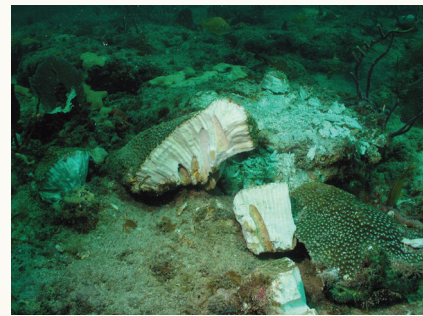
Gran coral estrella ( Montastraea cavernosa ) destrozado, resultante de un impacto.