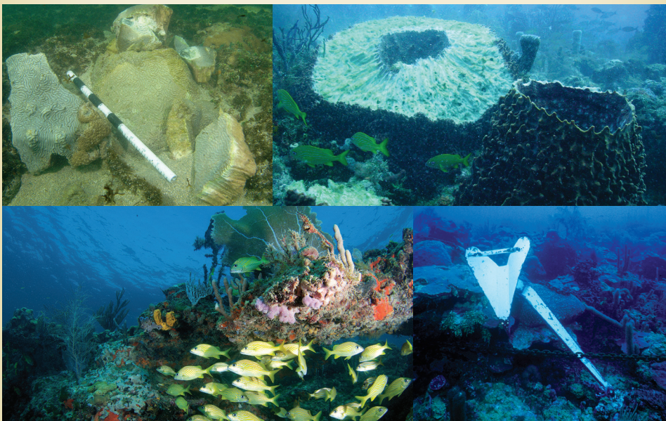
Encallamientos de barcos y los impactos del anclaje de barcos (De izquierda a derecha): knobby brain coral ( Diploria clivosa ) roto, cortada enorme esponja barril ( Xestospongia muta ), un ancla abandonada en el arrecife, y un arrecife de coral saludable en el sureste de Florida.

WWW.DEP.STATE.FL.US/COASTAL/PROGRAMS/CORAL/ Y WWW.DEP.STATE.FL.US/COASTAL/PROGRAMS/CORAL/RIPR.HTM